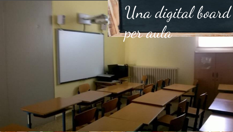
Una digital board per aula