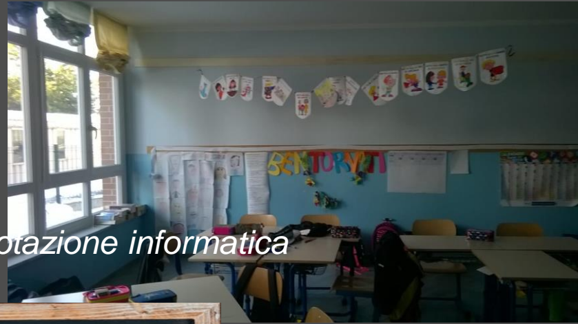
Ricca dotazione informatica